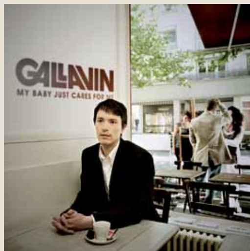
2 ème single - Publié en janvier 2012 Production: Gallavin