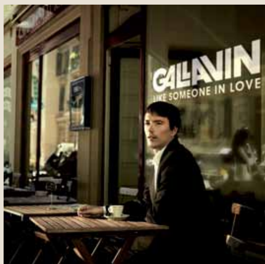
3 ème single - Publié en octobre 2012 Production: Gallavin